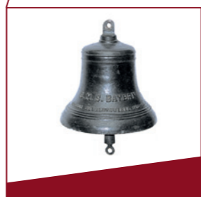
Schiffsglocke Diese Glocke stammt vom Schlachtschiff „Bayern“.