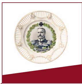
Wandteller Der populärste Heerführer des Krieges war Hindenburg.