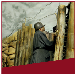
Schützengraben Ein Raum ist einem Schützengraben nachgebildet.