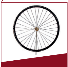
Fahrradreifen aus Draht Gummi war knapp. Hier ersetzt ihn eine Drahtspirale.