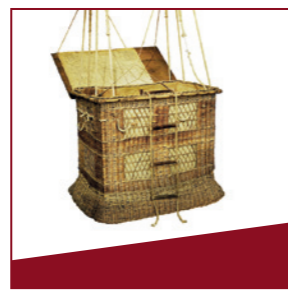
Ballonkorb Fesselballons dienten als Beobachtungsplattform.