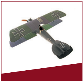
Flugzeugmodell Jagdflugzeug Albatros D V von 1917.