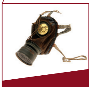
Gasmasken Seit 1915 gehörten Gasmasken zur persönlichen Ausrüstung.