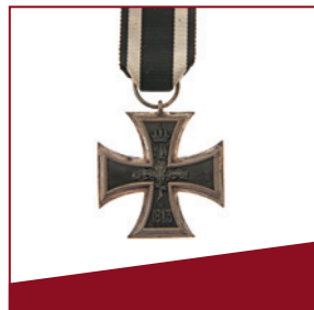
Eisernes Kreuz Eine Kriegsauszeichnung wird zum nationalen Symbol.