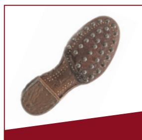
Stiefel Die Sohlen der Militärstiefel waren mit Nägeln beschlagen.